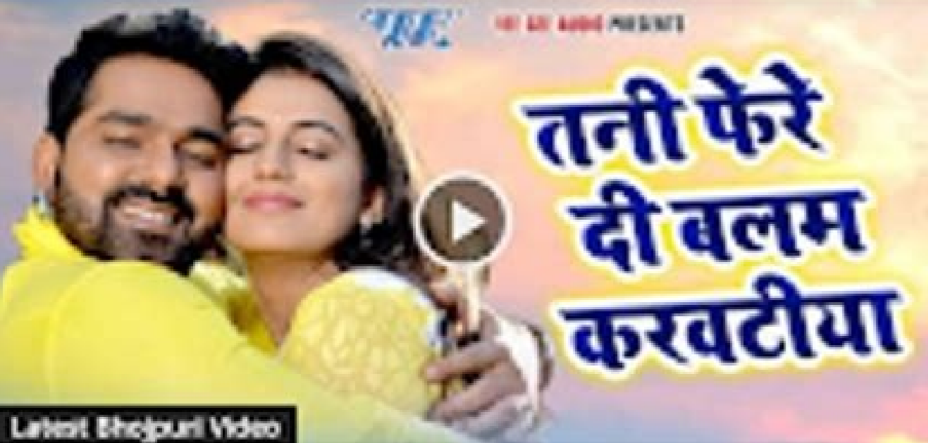
Latest Bhojpuri Video Superhit Song 2017 – Pawan Singh – Tani Fere Di Balam...