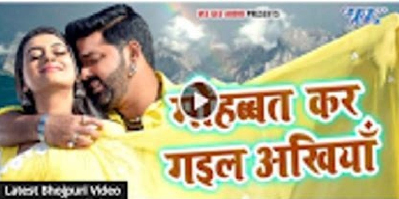
Latest Bhojpuri Video NEW रोमांटिक Song 2017 – Pawan Singh – Mohabbat Kar Gail...